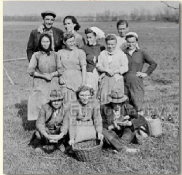
A dohánytermesztő brigád