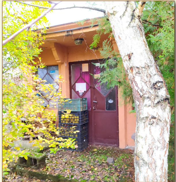
Az egykori tejsarnok mai állapota

A csarnokba vegyesen került a Tsz-ben és a háztáji gazdaságokban termelt tej. Ám a helyi lakosok szinte minden nap azt várták, mikor érkezik a Tsz teje és azt vásárolták, mert az jobb minőségű, egységes, azonos ízű, tiszta és friss volt. A háztáji tej „ingadozó” minőségű volt, hiába volt szűrőpróbaszerűen ellenőrizve. A teljes mennyiséget egyetlen átvevő képtelen volt folyamatosan ellenőrizni, ezért gyakran előfordult, hogy besegítettem az átvételnél.