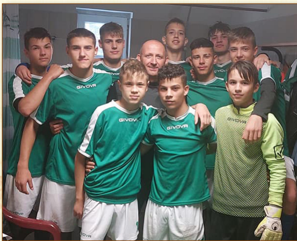
Az U16-os csapat az öltözőben

U7-U9-U11 és U13 csapataink továbbra is versenyeztetve vannak, ők is egyre ügyesebbek.