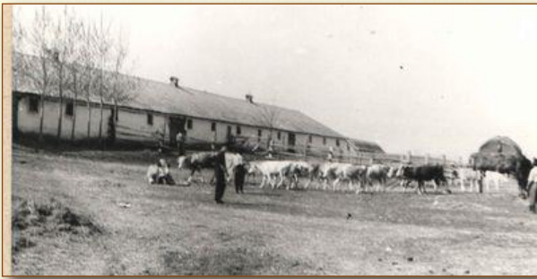
A birisi termelőszövetkezeti tehénistálló kifutóval 1963-ban (Tulajdonos: JAM, 5013 népr, 559/5013.)

1978-ban értük el, hogy a magyartarkafajta évente 3000 liter tejhozamot adott, így állatonként napi nyolc liter körüli tejről beszélhetünk, ami természetesen időszakonként változott, a körülmények függvényében.