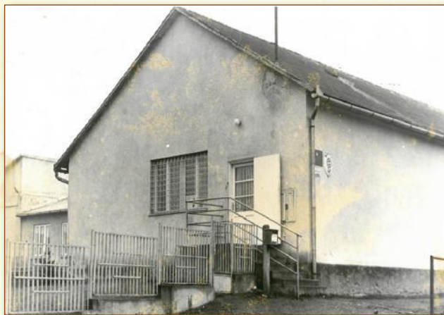
A negyedik postaépület az 1970-es évek végén

A II. világháborút követő években a MÁV épületében volt a település egyik telefonkészüléke. Az 1950-es évek elejétől ide érkeztek a postai küldemények is, amit talicskán vitt el a kézbesítő a postára, ahonnan aztán szétfordította a címzetteknek.