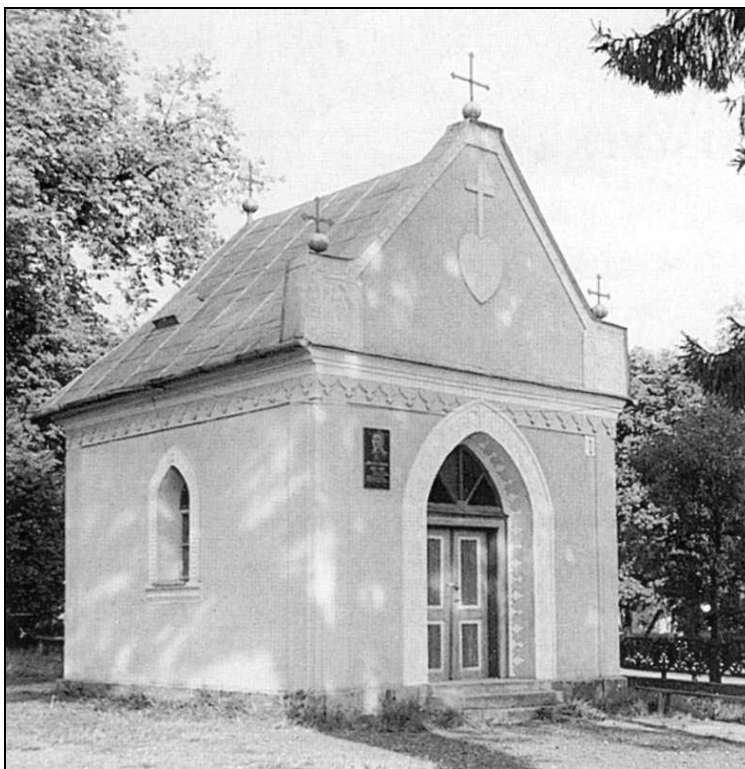
Az Orosz Péter Pál kápolna Bilkén 96

Orosz atya hivatalos temetését – harminckilenc évvel a halálát követően – 1992. augusztus 28-án tartották Bilkén.