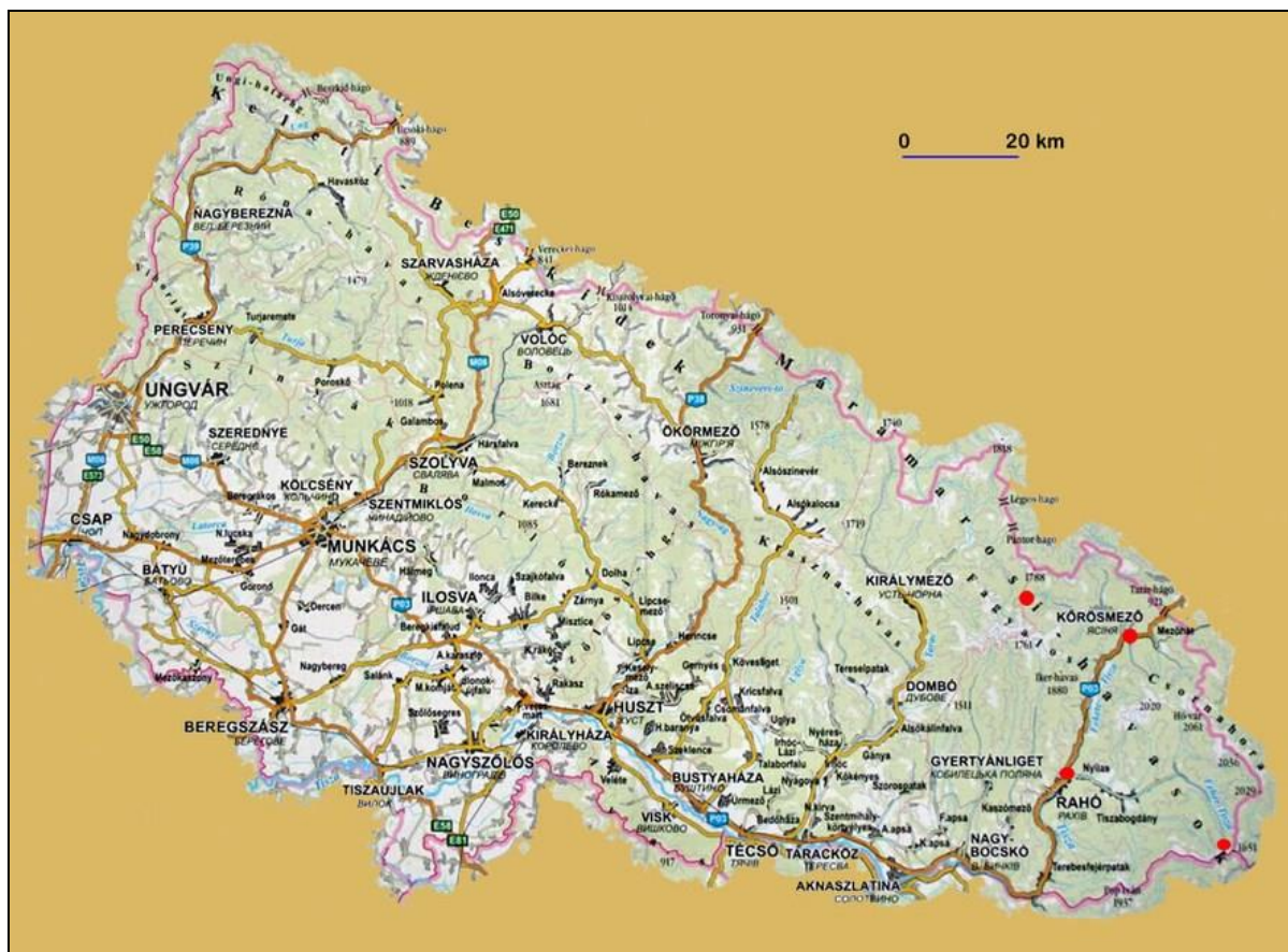
Kárpátalja magyar térképe 56

Puskás László szerint „a 20. századi totalitárius szovjetrendszer harciasan istentelen ideológiája az általa uralt területeken deklaráltan az istenhit és az azt ápoló egyházak elpusztítására törekedett. És mivel az egyház ott van, ahol a püspökök, akik papjaikkal együtt, azokat irányítva, az egyház működését, létének fenntartását is jelentik, a szovjethatalom célja a püspökök és a papok azonnali behódoltatása, illetve kiirtása lett.” 55