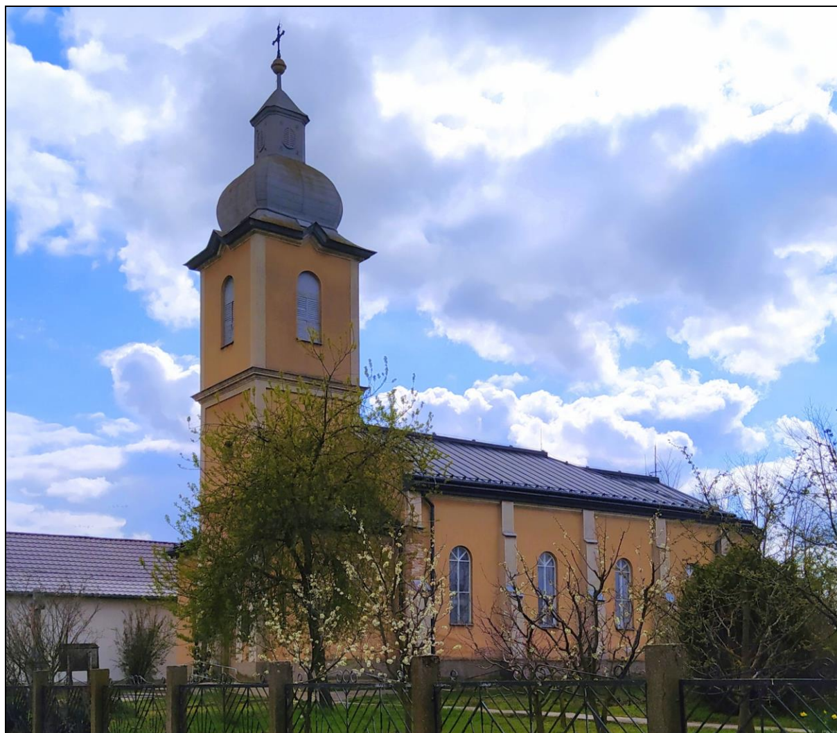
A Szent Mihály főangyal görögkatolikus templom (2023)