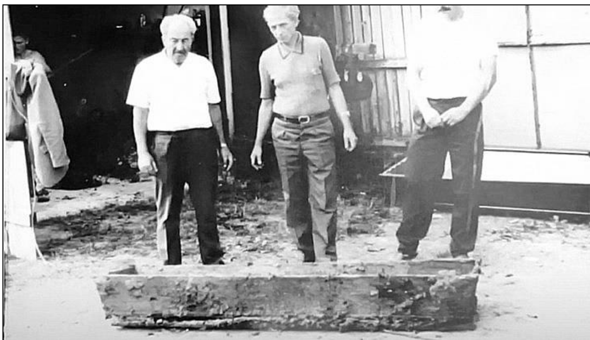
Az 1992. július 30-án kiemelt koporsó 92

Mindeközben Ukrajna, 1991. augusztus 24-én visszanyerte szuverenitását.